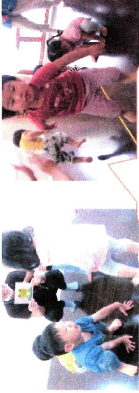
リトミックでかえるに なりきってジャンプ！