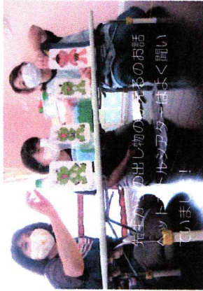
久しぶりの出し物の発表もお話 も楽しんで聞いていました！

久しぶりにみんなが保育園に集まって かえるまつりを楽しみました！！ お友だちと一緒にあそぶことができ 嬉しそうな笑顔があふれていました。