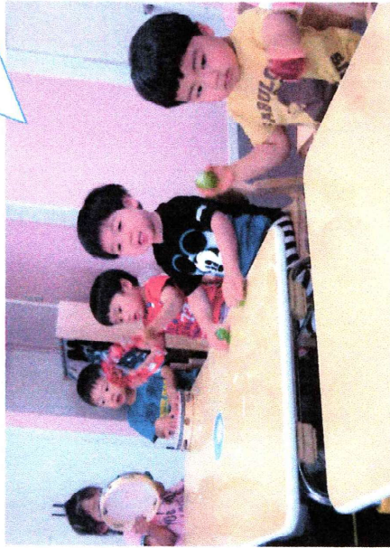
スタンプあそびでアジサイ のできあがり！ かえるさんも嬉しそう！